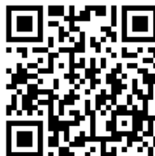
教師報名 QR code