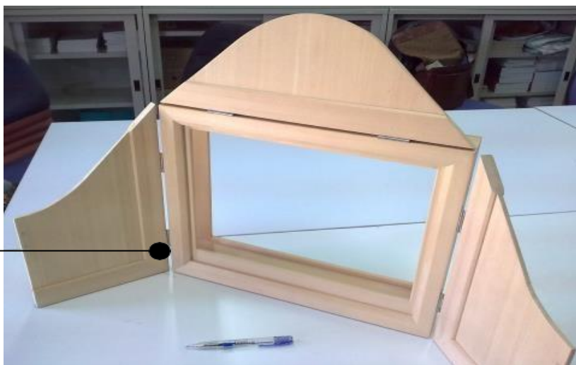
圖卡經由左方進行抽換。